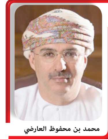
محمد بن محفوظ العارضي

يُنظّم صحار الدولي النسخة الافتراضية الخامسة لمنتدى «آراء»، والعاشر ضمن سلسلة منتدى رئيس مجلس إدارة صحار الدولي، في ١٧ يناير الجاري، وسيتم بثها مباشرة عبر قناة اليوتيوب الخاصة بالبنك، حيث يستضيف محمد بن محفوظ العارضي رئيس مجلس إدارة صحار الدولي، والدكتور روبرت ديكجراف أستاذ ليون ليفي ومدير معهد الدراسات المتقدمة في بريستون بولاية نيو جيرسي في الولايات المتحدة الأمريكية، والذي يعد أحد المراكز الرائدة والمتخصصة في مجال الأبحاث النظرية والتحقيق الفكري على مستوى العالم، حيث يستعرض المنتدى أبرز المتغيرات الرقمية، وانعكاساتها على البنى التحتية العلمية. والفاضل محمد بن محفوظ العارضي؛ يواصل منتدى «آراء» تحقيق أهدافه المتمثلة في نشر المعرفة والاستفادة من الخبرات والتجارب العالمية البارزة. وفي