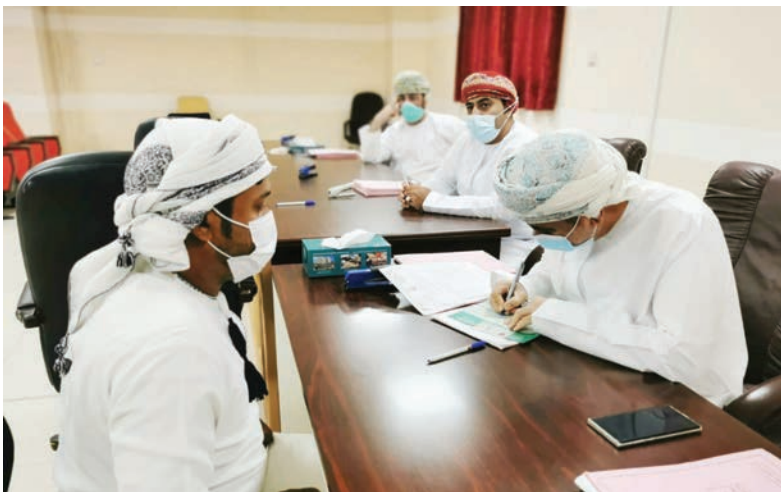
صحار - الرؤية

بالتعاون بين المواطنين، لضمان سلامتهم وفق ما جاء في قرارات اللجنة العليا المكلفة ببحث آلية التعامل مع التطورات الناتجة عن فيروس كورونا كوفيد-١٩. وأضاف البلوشي أن بلدية صحار ستعمل بوتيرة متسارعة على إنهاء الإجراءات للمتقدمين على سحب استمارات قطع الأراضي، وأن عليهم مراجعة دائرة الأراضي وفق الموعد المقرر، ليتسنى إنجاز هذه الإجراءات في فترة وجيزة وتحويلها إلى الجهات المعنية لإصدار سندات الملكيات.