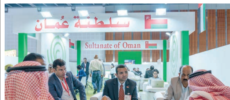
مسقط - الرؤية

بدأت السلطنة -مُمثلة بالمؤسسة العامة للمناطق الصناعية (مدائن)، وبالتعاون مع الهيئة العامة لترويج الاستثمار وتنمية الصادرات (إثراء) - أمس، مشاركتها في معرض الخليج للأغذية جلفود ٢٠٢٠، أحد أكبر المعارض التجارية السنوية للأغذية والضيافة في العالم، والذي يقام خلال الفترة ١٦-٢٠ فبراير الجاري في مركز دبي التجاري العالمي بدولة الإمارات العربية المتحدة، ويركز هذا العام على الأغذية الصحية بمشاركة أكثر من ٢٠٠ دولة، ممثلة به آلاف شركة توزع على ١٢٠ جناحا وطنياً.