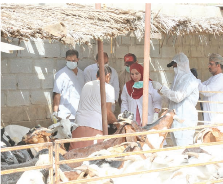
مسقط - الرؤية

انطلق، أمس، معسكر عمل «علاجي ووقائي» لمربي الثروة الحيوانية، تنفذه إدارة الزراعة والثروة الحيوانية بمحافظة مسقط؛ بهدف توصيل الخدمات البيطرية، وتقديم الإرشاد لمربي الثروة الحيوانية في المناطق البعيدة، ويصعب على أصحاب المواشي الوصول بحيواناتهم إلى العيادة البيطرية الثابتة، إلى جانب رفع الوعي لدى مربي الثروة الحيوانية في تلك المناطق بأهمية تواصلهم مع الكادر البيطري.