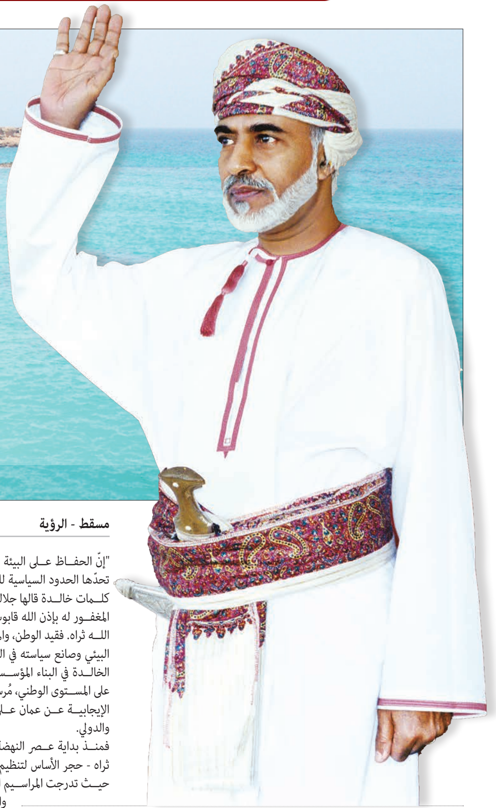
مسقط - الرؤية

"إن الحفاظ على البيئة مسؤولية جماعية لا تحدّها الحدود السياسية للدول". كلمات خالدة قالها جلالة السلطان الراحل المغفور له بإذن الله قابوس بن سعيد -طيب الله ثراه، فقيد الوطن، والمؤسس الأول للعمل البيئي وصانع سياسته في السلطنة طوال مسيرته الخالدة في البناء المؤسسي والتشريعي الناجح على المستوى الوطني، مُرسخاً الصورة الذهنية الإيجابية عن عمان على المستوى الإقليمي والدولي.