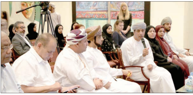
مسقط - الرؤية

ويُعد معاليه من المصورين الشغوفين بعالم التصوير الفوتوغرافي، وقد حصدت أعماله العديد من الجوائز المرموقة، كما أصدر معاليه العديد من الكتب المتخصصة في عالم التصوير التي وثقت ملامح الجمال الخاص بعمان. وفي حديثه عن الدافع وراء إطلاق مسابقة الزبير للتصوير الضوئي، تحدث معاليه قائلاً: «أؤمن شخصياً بقدرتنا على إيصال الصورة على الكمال، ومن هنا جاءت فكرة إطلاق هذه المسابقة لاكتشاف وتكريم المبدعين في هذا المجال، وأنا على ثقة بأنهم