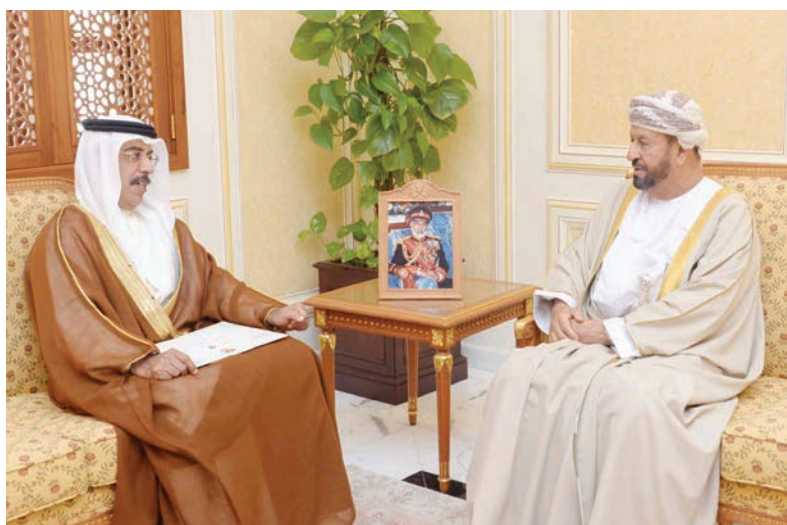
مسقط - الرؤية

استقبل معالي السيد بدر بن سعود بن حارب البوسعيدي الوزير المسؤول عن شؤون الدفاع مكتبته بمعسكر بيت الفلج صباح أمس معالي ماريا فيرناندا إيسينوزا رئيسة الجمعية العامة للأمم المتحدة وذلك في إطار الزيارة التي تقوم بها حالياً إلى السلطنة لإلقاء محاضرة بكلية الدفاع الوطني.