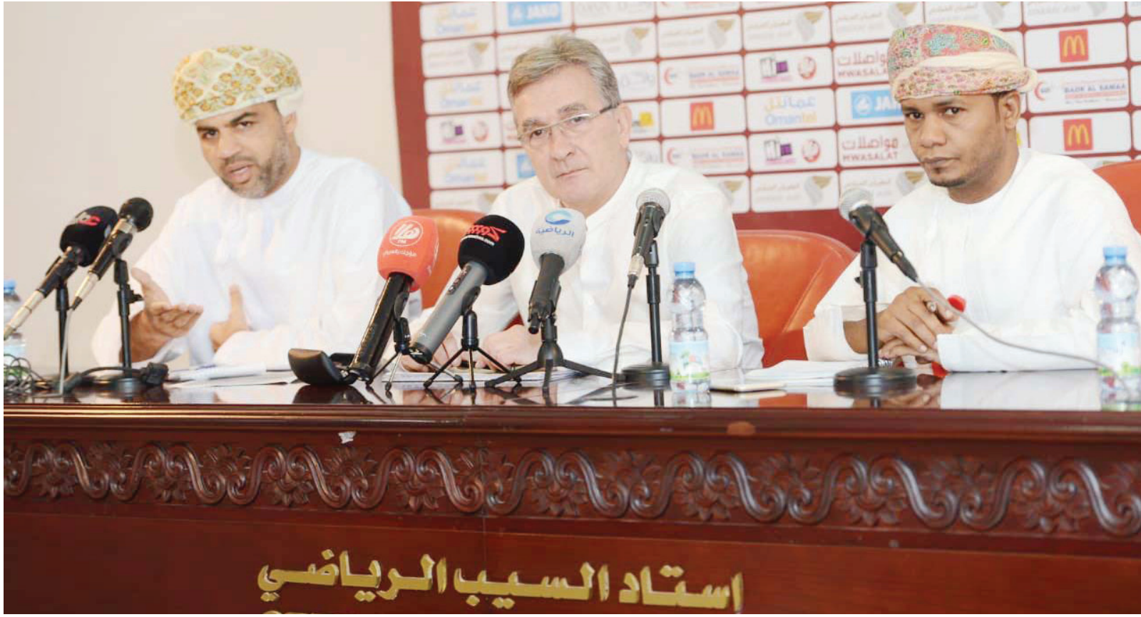
استاد السيب الرياضي