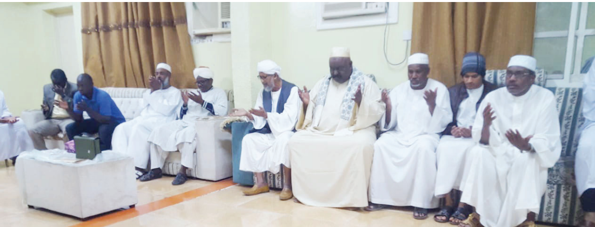
البريمي - سيف المعمرى

نظم أعضاء النادي الاجتماعي للجالية السودانية بالبريمي، جلسة تأبين لفقد الوطن والأمتين العربية والإسلامية حضرة صاحب الجلالة السلطان قابوس بن سعيد بن تيمور المعظم طيب الله ثراه. وتضمنت الجلسة ختمة للقرآن الكريم، كما رفع المشاركون أكف الضراعة إلى الله بأن يتغمده السلطان الراحل قابوس بن سعيد بن تيمور بواسع رحمته ويسكنه فسيح جناته، وينزله منازل الصديقين والأنبياء والصالحين وحسن أولئك رفيقاً. وتأتي الجلسة ضمن سلسلة من المشاركات التي يقيمها نادي الجالية السودانية بالبريمي لمشاركة أشقائهم العمانيين في